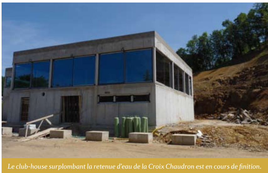
Le club-house surplombant la retenue d'eau de la Croix Chaudron est en cours de finition.

Reste aux élus à se décider en tenant compte des investissements déjà réalisés (5 millions d'euros) et de l'état très avancé des travaux dont la qualité paysagère est déjà largement perceptible.