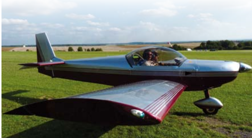
L'aérodrome de Villette est aujourd'hui le point de ralliement de plus de 80 pilotes de nationalité belge, française ou luxembourgeoise.

IL EST D'AUTRES ASPECTS QUE CEUX PUREMENT ÉCONOMIQUES QUI JUSTIFIENT LA PRÉSENCE DANS CETTE RUBRIQUE DE CELLES ET CEUX QUI JOUENT UN RÔLE DANS L'AGGLO. LE SPORT ET LA VIE ASSOCIATIVE, EN GÉNÉRAL, SONT PAR DÉFINITION GÉNÉRATEURS DE DYNAMISME. SURTOUT LORSQUE LE SPORT S'APPUIE SUR UN DES ATOUTS DU TERRITOIRE : LE CARACTÈRE TRANSFRONTALIER.