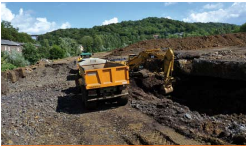
40 000 m 3 de déblais entre le city stade de Réhon et les abords de l'usine pour l'aménagement d'un bassin de compensation.

T out le monde a encore en mémoire ces images d'habitations entièrement dévastées, dans le sud de la France ou ailleurs, par des cours d'eau en furie. Pour mettre fin à ce genre de situations, un principe s'applique désormais : chaque fois que l'on construit à proximité d'une zone inondable et uniquement lorsqu'il n'y a pas d'autres alternatives aux regards des enjeux, il faut compenser les volumes occupés. Au bord de la Chiers, l'extension de l'usine Lorraine Tubes à Réhon rentre dans ce schéma. Après une étude diligentée par le Syndicat intercommunal d'aménagement de la Chiers qui soulignait le risque de crue, la décision de réaliser ce bassin de compensation volumique a été prise. D'où les travaux qui se déroulent actuellement entre le city stade de Réhon et les abords de l'usine. Soit le terrassement de 40 000 m 3 de déblais à moins de 1,50 mètre sous le terrain actuel. De cette manière, en cas de débordement intempestif, l'eau pourra se glisser naturellement dans ces 3,5