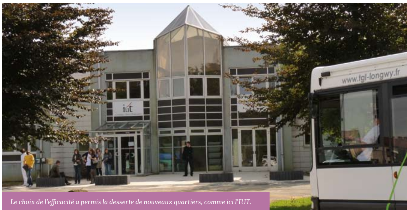
Le choix de l'efficacité a permis la desserte de nouveaux quartiers, comme ici l'IUT.

LA COURBE POUR LA FLUIDITÉ ET LE VERT POUR L'ENVIRONNEMENT, LE NOUVEAU LOGO DU TGL SE VEUT À L'IMAGE DE LA NOUVELLE ORGANISATION DU RÉSEAU : RAPIDE, EFFICACE ET PLUS ÉCOLOGIQUE.