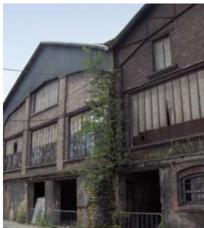
Un des objectifs de l'OPAH : lutter contre l'habitat indigne.

■ les besoins spécifiques pour les propriétaires âgés : 85 propriétaires occupants seraient potentiellement