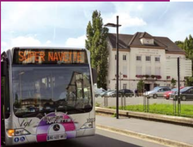
Pour rejoindre Pôle Europe, la Supernavette passe désormais par Herserange.