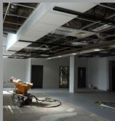
Côté Pôle Emploi, la partie accueil ouvre sur un large espace dédié au public.

Une dizaine de bureaux individuels aux cloisons modulaires permettront de procéder aux entretiens. Pour l'accueil des malentendants, les faux plafonds sont équipés d'une boucle magnétique afin de percevoir les sons diffusés. Après la réunification des deux institutions, Assedic et ANPE, en un seul établissement, le site de Pôle Emploi s'était provisoirement installé avenue de Saintignon à Longwy-Bas, dans des locaux beaucoup trop exigus pour les 44 agents. Aujourd'hui, à la Maison de la formation, l'accent est mis sur la qualité de l'accueil, avec notamment la création d'un espace spécifique dédié aux employeurs et des salles de réunions pour les