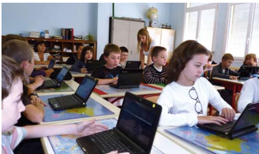
De son poste, l'enseignant a accès aux travaux individuels des élèves et reprend ensuite le travail en groupe sur le tableau, non pas noir, mais blanc – tableau électronique oblige !

IL EST BIEN LOIN LE TEMPS DE LA PLUME ET DE L'ENCRIER ! AUJOURD'HUI, MÊME DANS LES ÉCOLES RURALES, L'ÈRE DU NUMÉRIQUE A PRIS LE RELAIS.