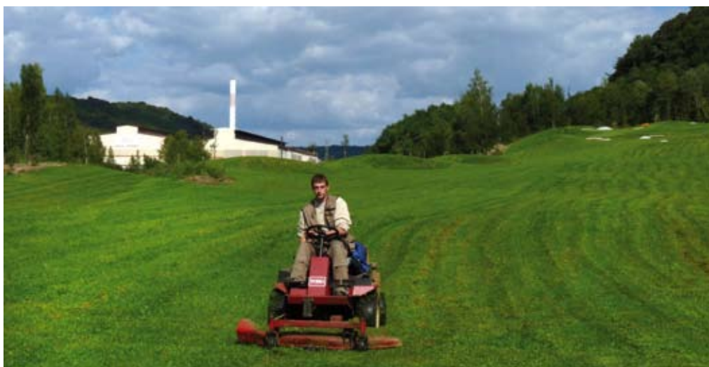
Engazonné et doté d'un arrosage automatique, le 9 trous école a été achevé cet été.

Reste le troisième chantier : le 18 trous qui serpente entre les tours de refroidissement et le site de l'ancien crassier sur le plateau de Mexy. Un parcours dont les terrassements sont achevés à près de 90 % et dont on distingue nettement les modelés. Ne lui manque que l'irrigation et l'engazonnement. C'est sur cette partie de l'équipe-