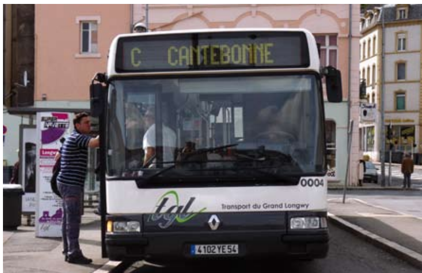
Le Sitral regroupe 15 communes qui ne font pas toutes forcément partie de la CCAL.

LA MOBILITÉ EST UN ENJEU IMPORTANT DE L'AGGLOMÉRATION. LES REPRÉSENTANTS DES COMMUNES SONT LARGEMENT REPRÉSENTÉS AU SEIN DE L'ENTREPRISE DE TRANSPORT ET DU SYNDICAT INTERCOMMUNAL, AUTORITÉ ORGANISATRICE DES TRANSPORTS. IL EXISTE DEUX ENTITÉS JURIDIQUES QUI PRÉSENTENT AUX DESTINÉES DU TRANSPORT URBAIN SUR L'AGGLOMÉRATION : LE SITRAL ET TGL.