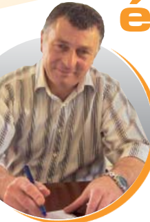
Édouard Jacque Président de la Communauté de communes de l'agglomération de Longwy