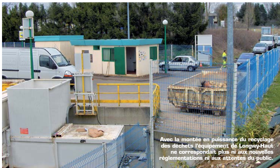
Avec la montée en puissance du recyclage des déchets l'équipement de Longwy-Haut ne correspondait plus ni aux nouvelles réglementations ni aux attentes du public.

Retrouver toutes les informations sur les horaires d'ouverture de l'actuelle déchetterie sur le site Internet www.ccal-longwy.fr